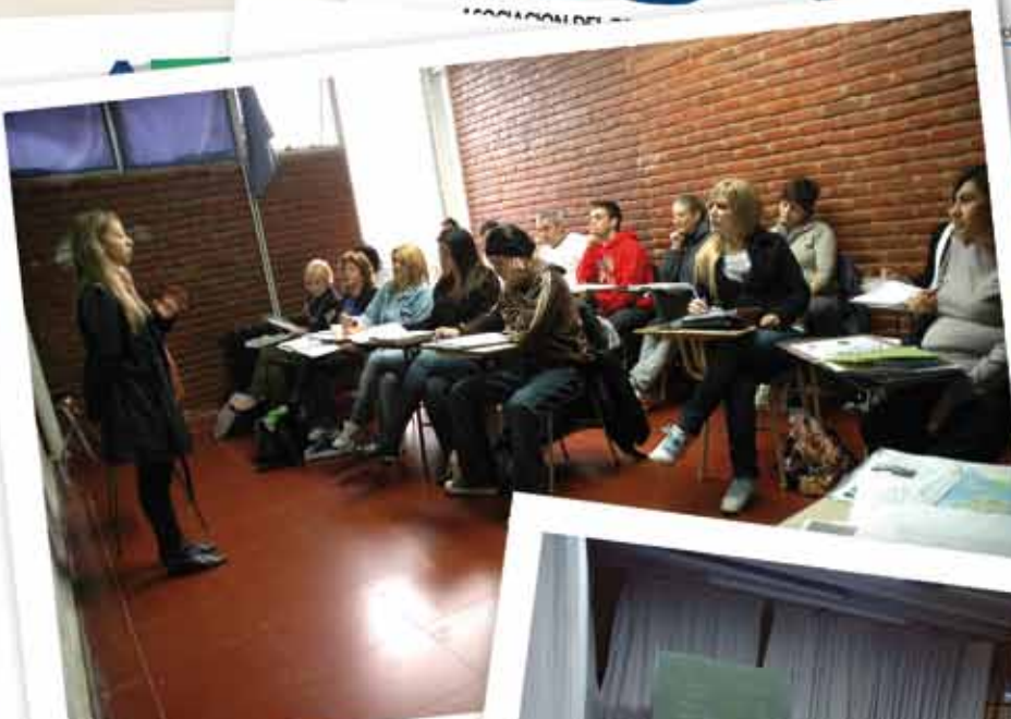
Comisión 2, Facultad de Económicas

Finalización de estudios primarios y secundarios para jóvenes y adultos