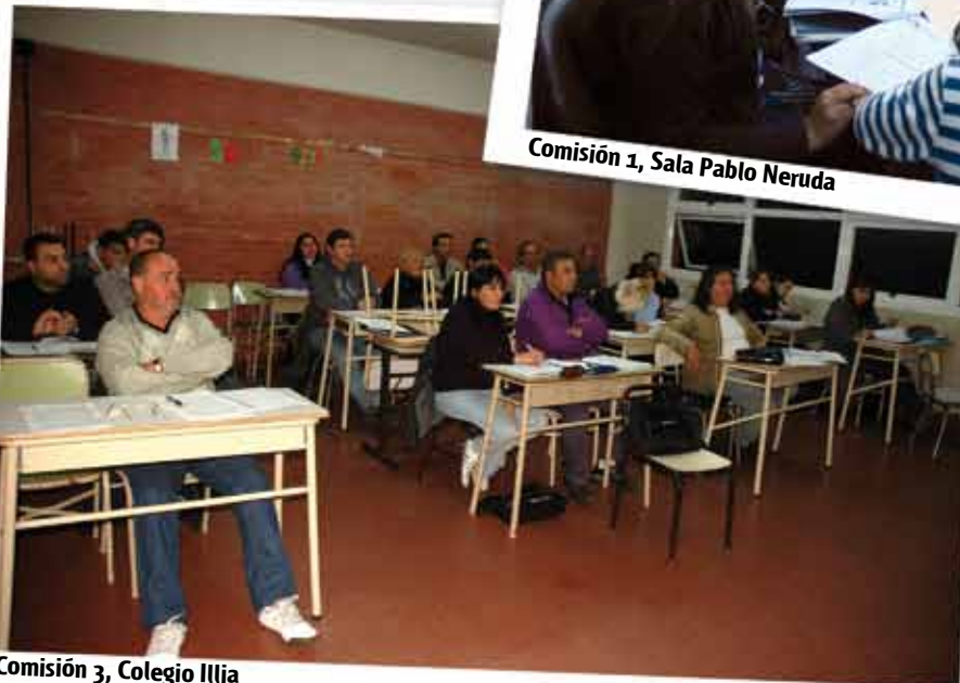
Comisión 3, Colegio Illia

PRIMARIOS o SECUNDARIOS, MIÉRCOLES de 12 a 14 hs. adu.ar