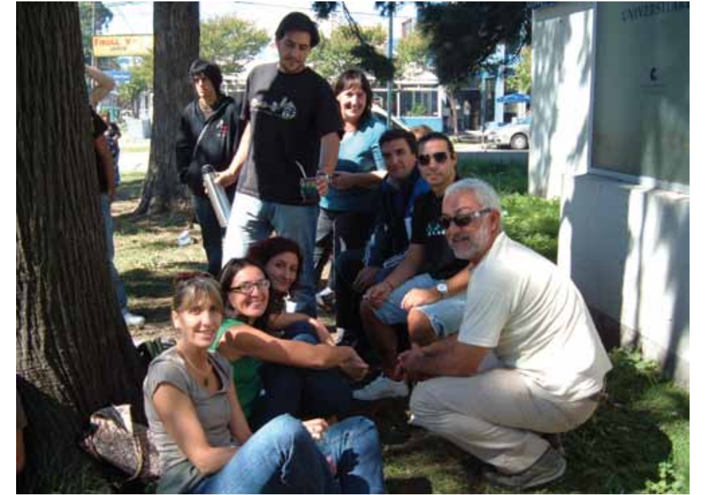
» Los compañeros de Agrarias viajaron para participar de la Jornada en el Comedor Universitario

La Asamblea convoca a más de 150 compañeros/as del sector en el Aula 50 del Complejo Universitario. Se pone en conocimiento de los compañeros que mientras se desarrolla este conflicto en que pedimos la incorporación de Personal, la Gestión contrató una cooperativa para realizar tareas de limpieza y mantenimiento que corresponden al Personal Universitario. Luego del debate, la Asamblea decide, ante la falta de respuestas y en repudio a las tercerizaciones, realizar un Paro el viernes 18 de marzo. Finalmente la Asamblea resuelve convocarse nuevamente el día martes 22 de marzo a las 12:00 hs. en la sede del Rectorado.