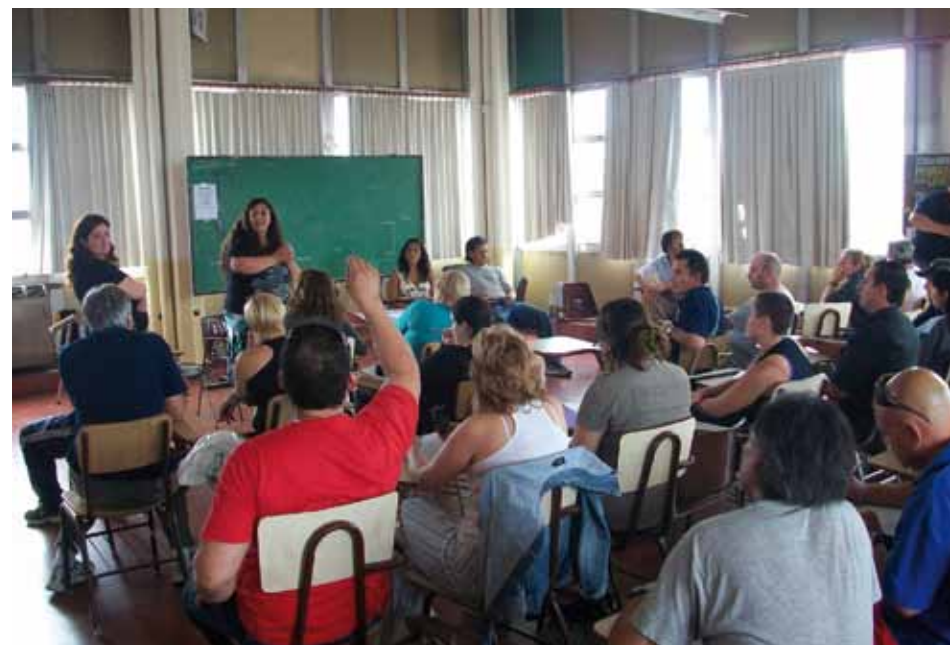
» Última charla informativa, previa a la puesta en marcha del Plan

Te voy a contar algo. Hace 12 años había elecciones en el Sindicato de Pepsicola. Había dos listas, y entre ellos habían resuelto que el que ganaba se llevaba todo. Ganó una de las dos listas y se quedó con todos los cargos. Realmente fue un fracaso. Porque ganó por 55 % a 45 %. Casi la mitad no estaba representada en esa dirección. Y bueno, fue un caos y una división muy grande, durante dos años. Hasta que la nueva elección fue proporcional. Y ahí se acomodó. No hay muchos antecedentes de esto. Te cuento esta y puede ser que haya habido una o dos más. Pero siempre es muy reprobado por la gente si eso sucede, porque se lo ve como algo muy autoritario. Y es muy coyuntural la Dirección. Entonces hay que tener la proporcionalidad, porque la proporcionalidad es la que garantiza la pluralidad. «