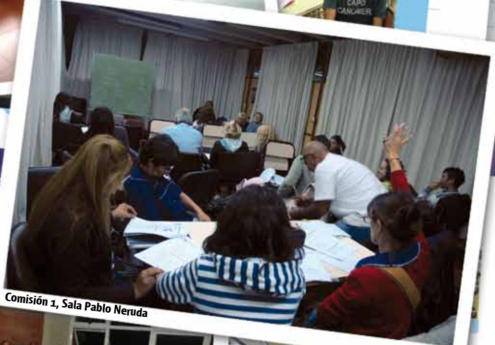
Comisión 1, Sala Pablo Neruda