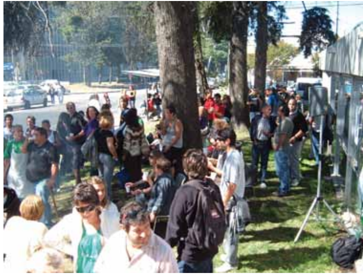
» Concentración en el Comedor Universitario