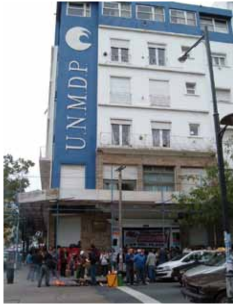
» Concentración en Rectorado