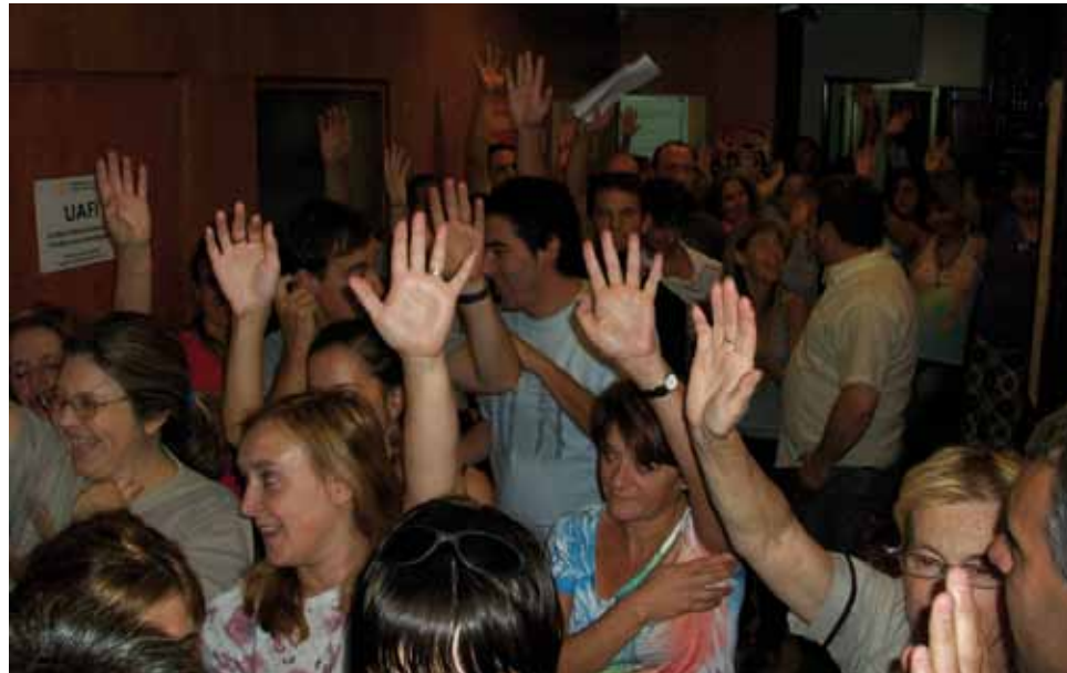
» La Asamblea vota las medidas de fuerza

No hay soluciones mágicas para nuestros reclamos. Así puede verse en la cronología detallada del conflicto que aquí publicamos. Los resultados de este proceso son la resultante del trabajo arduo de nuestro gremio, a través de todas sus instancias orgánicas, con el compromiso de todos los compañeros. En esta nota encontrarán todos los movimientos que se hicieron desde la primera paritaria de julio del 2010, hasta la firma del acuerdo, el 7 de abril de 2011